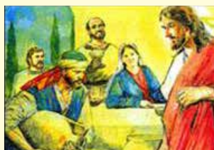
Il segno alle nozze di Cana.